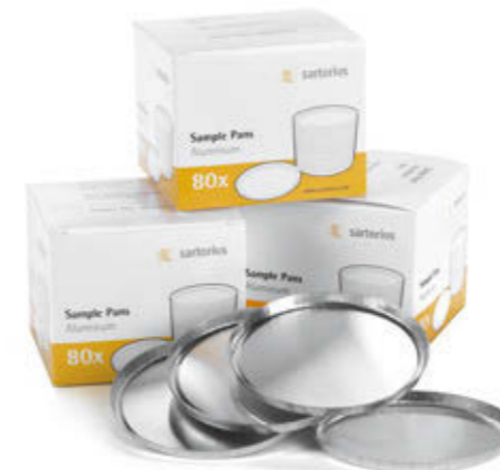
Piattelli portacampione monouso