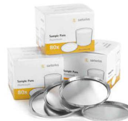
Piattelli portacampione monouso